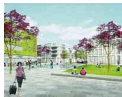
Quartier am Wiener Platz – Visualisierung Quartier am Wiener Platz (Schüler-Architekten).

Firma Bosch: das Unternehmen wächst beständig in Feuerbach. Aktuell sind es wohl 14.000 Arbeitsplätze und viele Standorte innerhalb unseres Stadtbezirkes. Interessant zu wissen: es gibt eine Arbeitsgruppe innerhalb von Bosch aus ca. 8 Mitarbeitern, die sich um das Verhältnis Bosch – Feuerbach kümmern soll und dazu Projektideen entwickelt. Auch der GHV wurde dazu schon befragt, u.a. möchte Bosch wissen, ob wir noch Rabattaktionen für den Einkauf der 14.000 Mitarbeiter in Feuerbach anbieten.