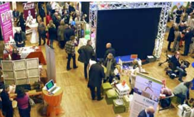
Blick ins Messetreiben mit Infoständen

Weitere Informationen dazu folgen zeitnah auf www.ghf-feuerbach.de und www.feuerbach.de