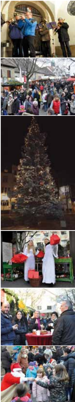
Impressionen von der „Feuerbacher Weihnacht 2015“